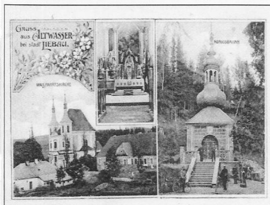
Dobová pohlednice. Kostel s klášterem, interiér kostela a Královská studánka.