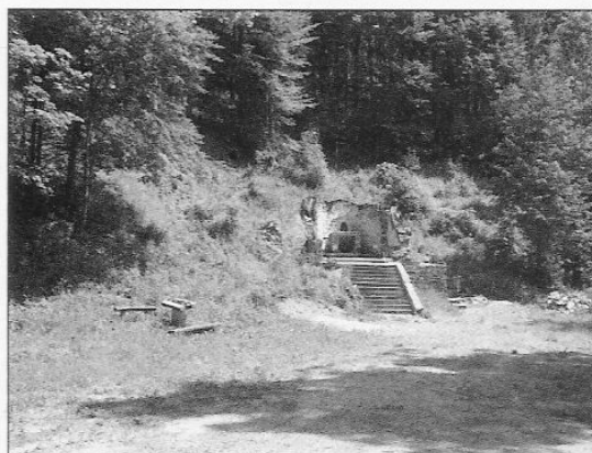
Současný stav Královské studánky. Nebýt práce skautů, nebylo co fotit.