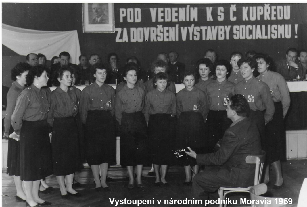
Vystoupení v národním podniku Moravia 1959

se školou a velice rádi jezdili společně s dětmi na výlety, učili mladé jiskry a pionýry, účastnili se hudebních vystoupení v blízkém okolí. Svazoval je zpěv, přátelství, legrace, práce a také i to umění odpočinout si od celodenních starostí. V jejich době nebylo tolik technických vymožeností jako např. dnešní počítače, televize, internet, mobilní telefony a tak si hledali cestu k sobě osobním kontaktem, společným setkáním a oním zpěvem.