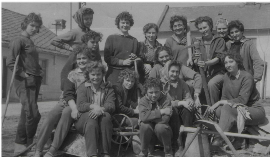
Úprava parčíku a budování pomníku rudoarmějcům k 15. výročí osvobození republiky v roce 1960