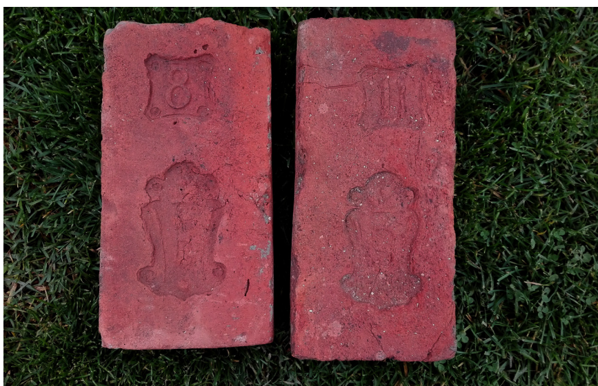
Cihelna velkostatku Velká Bystřice, která patřila Olomoucké kapitule.